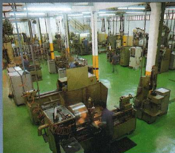
Linha de Produção.

CHRISTENSEN RODER Produtos Diamantados Ltda