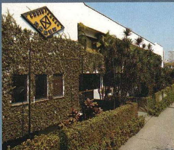
Matriz de São Paulo.